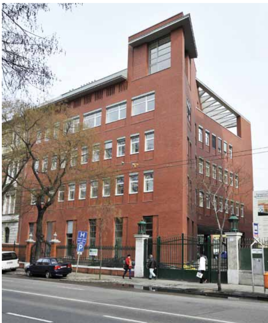
A Fresenius 2010-ben átadott új építésű dialízis központja a Péterfy Sándor utcai Kórház területén