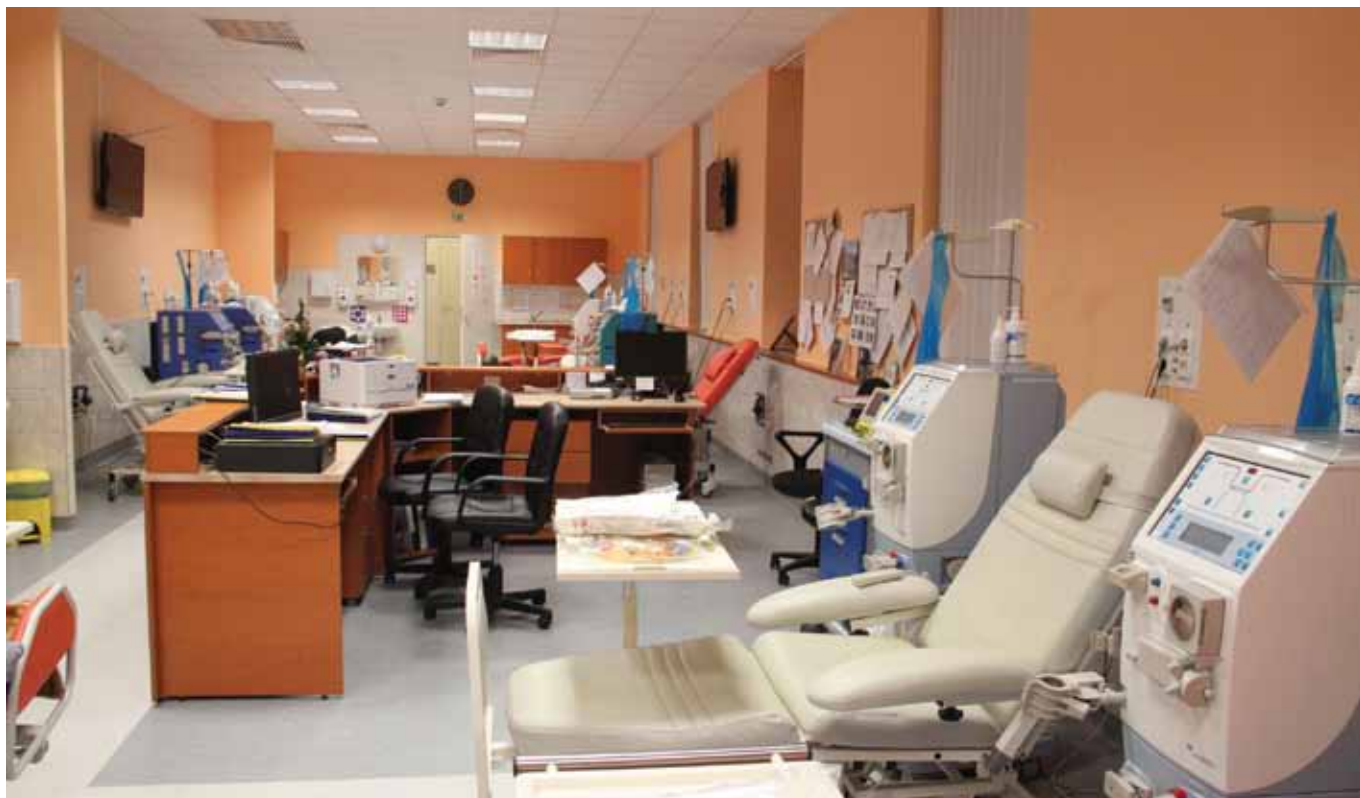
A Diaverum Rókus Kórházban működő dialízis központja